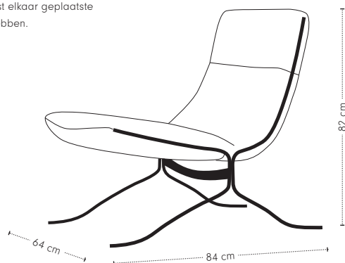
hoogte + breedte + diepte